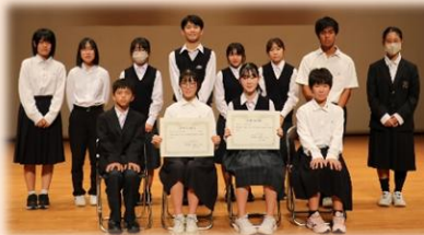
英語スピーチコンテスト